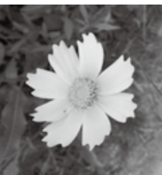
根から引き抜き適切に処分を