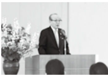
新規採用職員入所式で(1日)