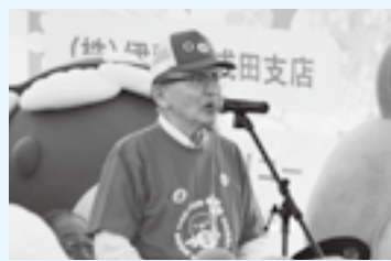
うなりくんグッズを身に付けて(23日)

いようにし、小動物を入れている籠などはカバーを掛ける ○薬剤がかかった時は水で洗って落とす。心配な場合は農政課(☎20・1541)へ、緊急時は成田赤十字病院(☎22・2311)へ相談する ※くわしくは同課へ。