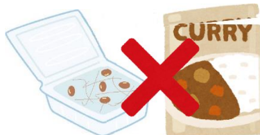
納豆のパックや レトルト食品のパウチ等