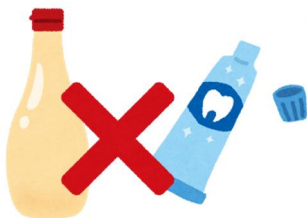
マヨネーズの容器や 歯磨き粉のチューブ等