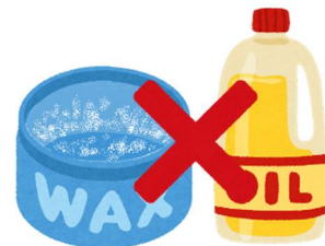
整髪料や 油の容器等