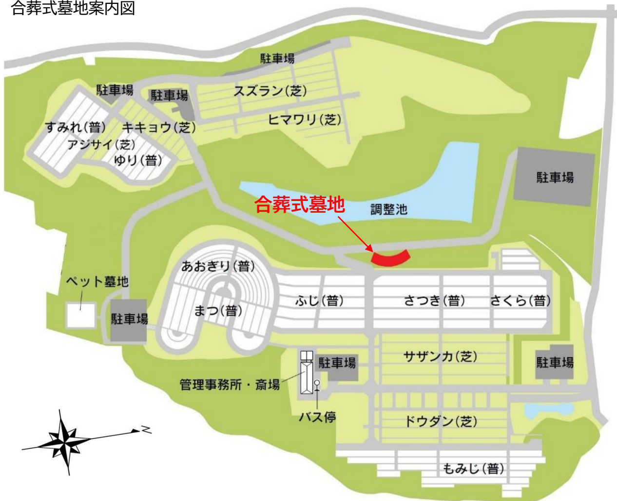
合葬式墓地案内図