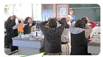
セルフヘッドマッサージ