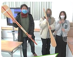
栄養講座・調理場見学・給食試食