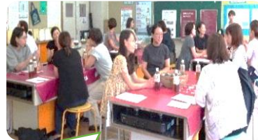
防災ワークショップ