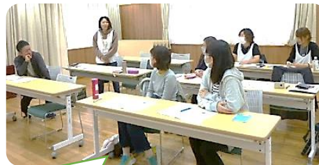
アンガーマネジメント