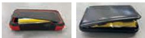
膨らんでいるモバイルバッテリー例

市役所5階クリーン推進課（20-1530） 成田市リサイクルプラザ（36-1000）