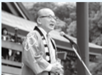
開幕式であいさつ(18日)