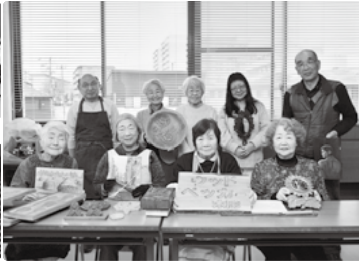
思い出の作品と共に

私たち「ウッドペッカー」は毎週木曜日に加良部公民館で活動している木彫りを楽しむサークルです。