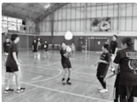
風船を落とさないように

ハンドボールの日には、鬼っこなどの遊びの要素を取り入れたウォーミングアップをした後、ステップやシュートといった基本動作や試合形式の練習を行います。