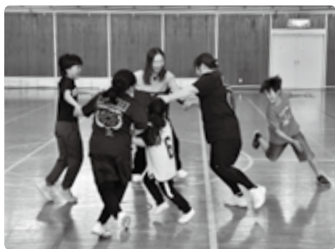
協力して鬼から逃げる