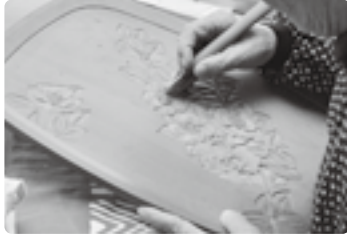
細かい部分も丁寧に