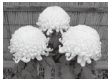
菊花会が育てた大菊