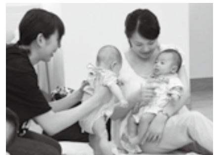
参加者同士の交流も