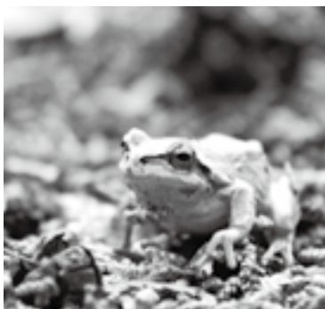
生物多様性の指標の1つとされるカエル