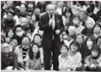
春巡業・大相撲成田場所(10日)