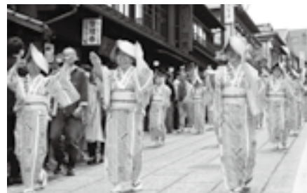
浴衣姿で晴れやかに