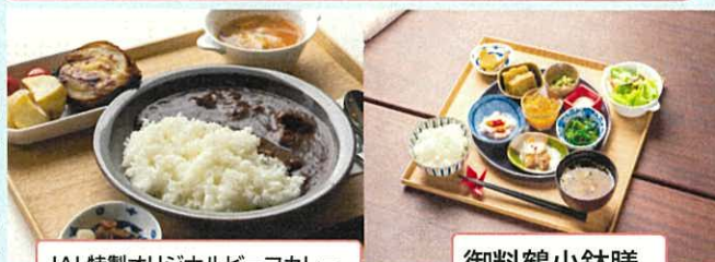
JAL特製オリジナルビーフカレー

住所:成田市川上245-219 営業時間:平日11:00~15:00 土日11:00~16:00(ランチ)17:30~21:00(ディナー・土曜日のみ) 電話:0476-36-5272