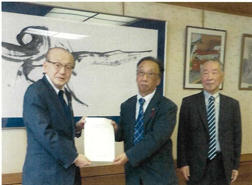
左から、小泉市長、諏訪会長、矢崎職務代理者

令和8年3月27日、成田市農業委員会では農業委員会等に関する法律第38条第1項の規定に基づき、「農地等利用最適化推進施策に関する意見書」を市長に提出しました。