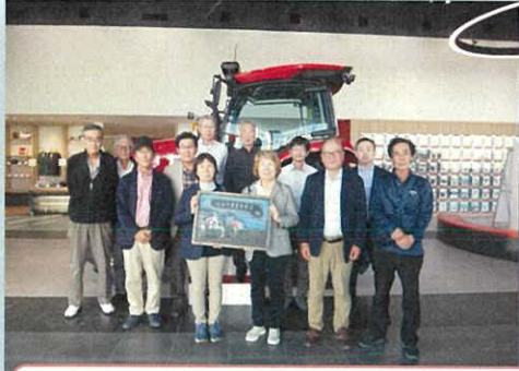
「ヤンマーアグリジャパン」にて、最先端の農業機械の説明を受け、スマート農業に関する展示品などを見てきました。

10月16日(木)から17日(金)にかけて、茨城県・福島県方面へ視察研修を実施しました。今回の視察で、専門的な知識や農業の成功事例を見学することができ、とても有意義な研修となりました。