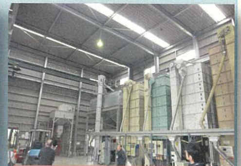
100haを超える水田を経営している農業法人「KファームNAITO」にて