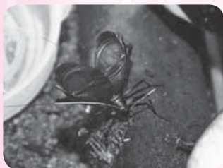
広げた羽をこすり合わせて鳴く

「土は常に少し湿った状態を保ち、餌にカビが生えないように気を付けて」とアドバイスするのは、メンバーの1人で飼育歴40年以上の長