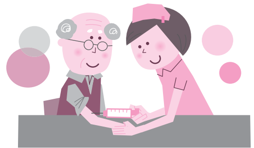
高齢者インフルエンザ個別予防接種実施医療機関(市内) (問診票は医療機関に置かれています)

で、保険証など確認できるものを持ってきてください。くわしくは健康増進課(☎27・1