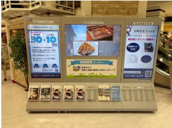
イオンモール成田「わが街NAV I」