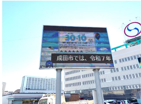
成田富里タウンビジョン