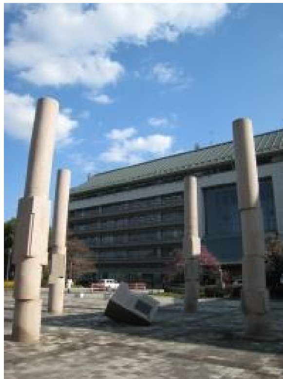
「成田市平和のためのメンヒル」