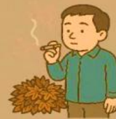
●燃えやすい物の近くでの喫煙