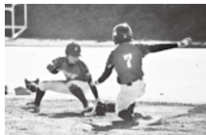
練習から全力でプレー