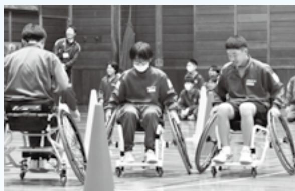
初めての競技用車いすに挑戦