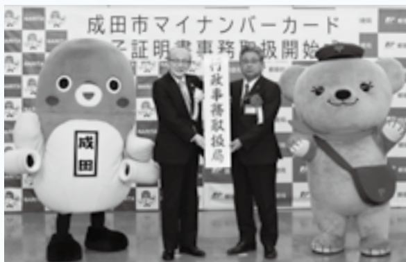
新たな窓口の開設を記念して