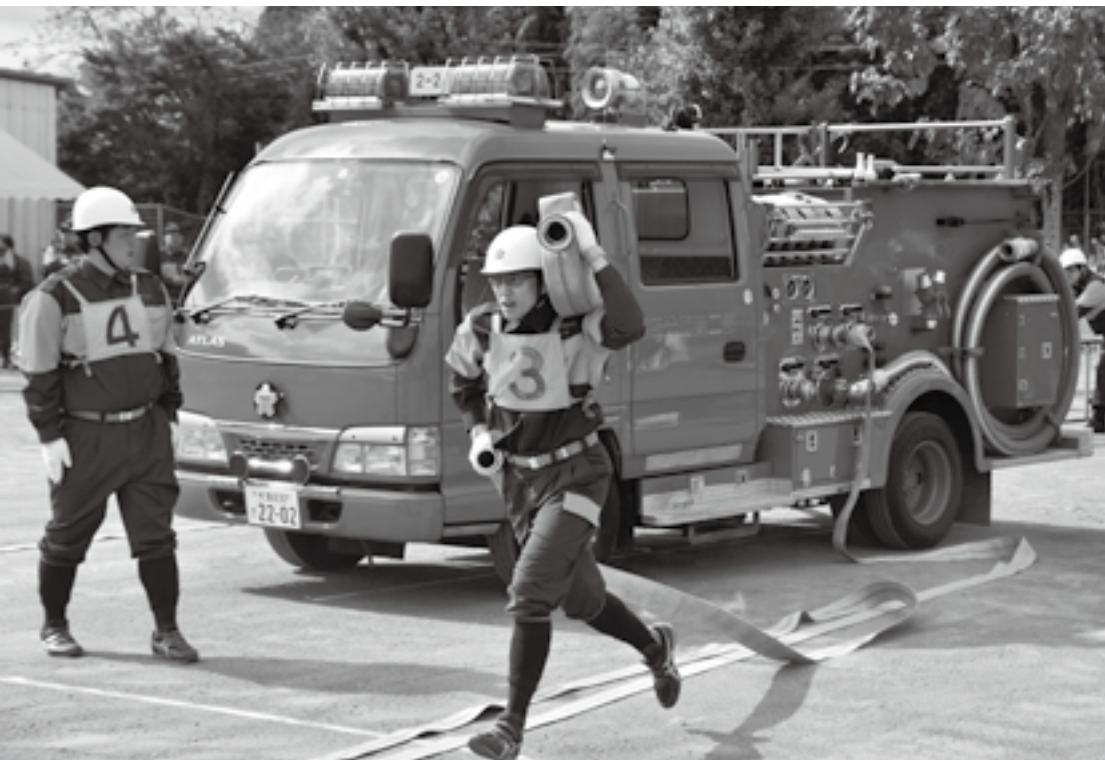
火災に備えて訓練

火災や河川の氾濫、崖崩れなど、災害時に真っ先に駆け付ける消防団。私たちの先頭に立ってまちを守るため、日々活動しています。