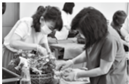
バランスを考えて

※申し込みは2月17日(火)から重兵衛スポーツフィールド中台体育館(☎26-7251)へ。