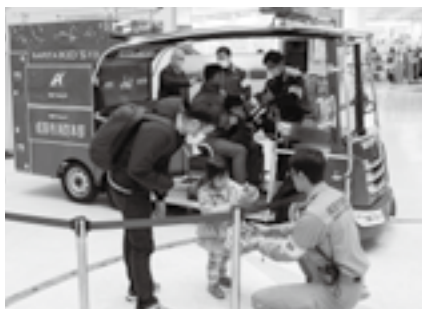
ちびっこ消防車が出動

防火や防災への関心を高めてもらうため、火災予防イベントを開催します。 日時＝3月1日(日) 午前10時～午後3時 会場＝ユアエルム成田店1階センタープラザほか 内容＝ちびっこ消防車や災害時に使用する資器材の展示、消防音楽隊によるコンサート