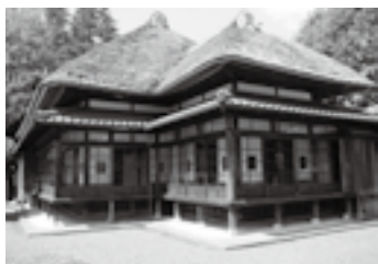
上／貴賓館 下／三里塚御料牧場記念館 (場所：三里塚記念公園内)