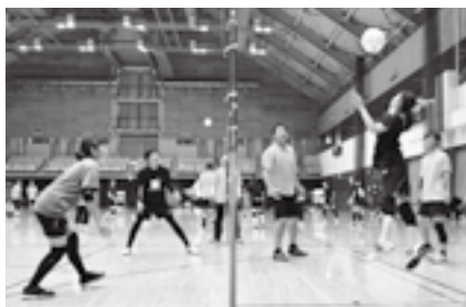
相手コートを目掛けて

※申し込みは2月10日(火)までに市スポーツ推進委員連絡協議会事務局(スポーツ振興課・☎20-1584)へ。