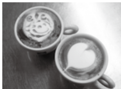
自分だけの一杯を

※くわしくは同館(☎27-5911、第1月曜日、祝日、1月13日(火)は休館)へ。