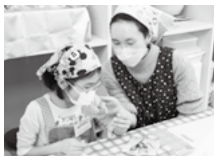
どんな形にしようかな

※申し込みは1月7日(水)から同センター(☎40-4880、1月12日を除く月曜日、1月13日(火)は休館)へ。