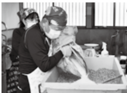
伝統的な製法を学んで