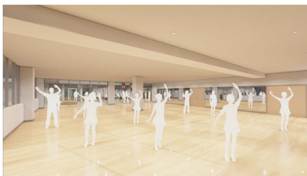
スポーツエリア（スタジオ）

※提案イメージ図は、提案資料として提出されたものであり、実際の整備内容とは異なる場合があります。