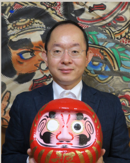
日本人形文化研究所 所長