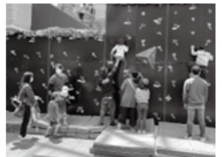
ボルダリングにも挑戦

日時=4月27日(土)~29日(月・祝)、5月3日(金・祝)~6日(月・振休) 午前10時~午後4時 会場=イオンモール成田1階和み広場 内容=ブレイクダンスや自転車競技BMXのステージイベント、千葉ジェッツ(バスケットボールチーム)・クボタスピアーズ(ラグビーチーム)・鹿島アントラーズ(サッカーチーム)による体験会など 参加費=無料 ※参加を希望する人は当日直接会場へ。くわしくはスポーツ振興課(☎20-1584)へ。