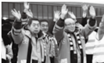
手を振って見送る(23日)