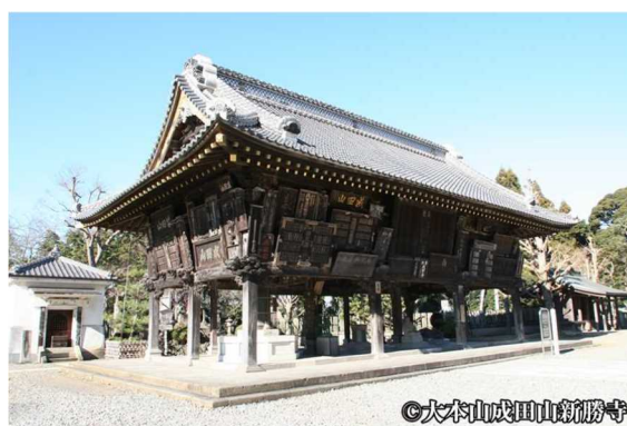
成田山新勝寺額堂 （国指定重要文化財）