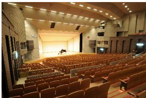
成田国際文化会館