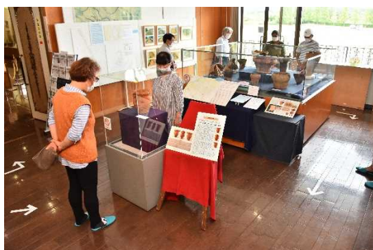
下総歴史民俗資料館展示企画展