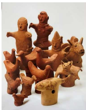
南羽鳥正福寺1号墳出土埴輪 （市指定文化財）

※記録選択：文化財保護法で、重要無形文化財以外の無形文化財のうち特に必要のあるものを選択して、自らその記録を作成し、保存し、又は公開することができることとされていることによるものです。