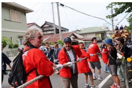
友好・姉妹都市交流