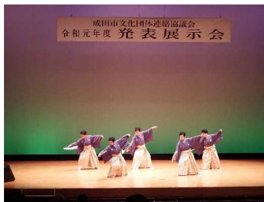
文化団体連絡協議会発表展示会