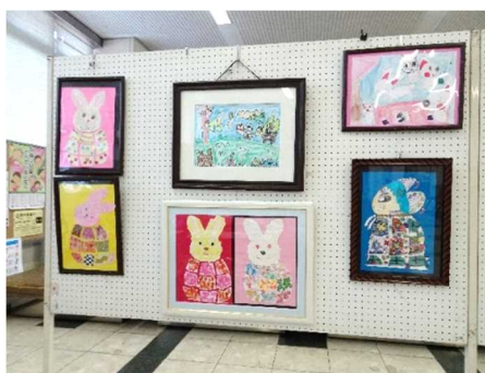
自閉症などの発達障がいのあるひとたちの絵画展