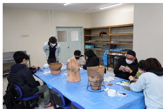
滑河文化財保存展示施設体験教室