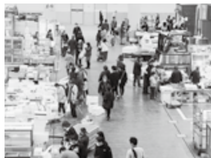
買い物客でにぎわう