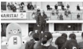
開会式であいさつ(28日)