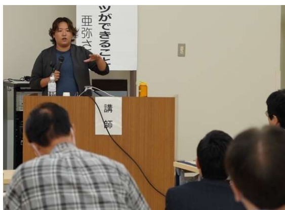
▲スポーツの歴史とジェンダーについて わかりやすく講義いただきました