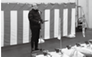
成田市場初市式で(5日)