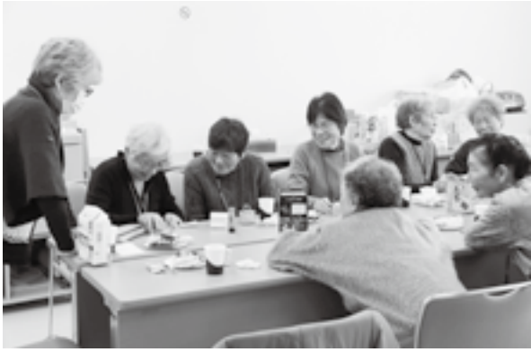
おしゃべりを楽しむお茶会の時間