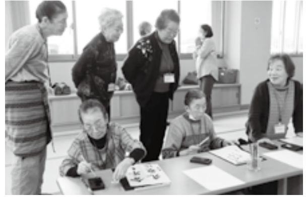
ミニイベントの書き初めで新年の抱負を