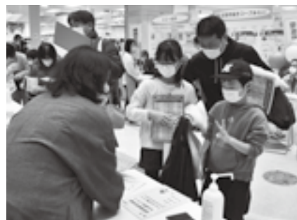
クイズの答えを家族で考える

電気・ガス・環境などについて、暮らしに役立つヒントなどを紹介します。 住みよい暮らしの情報を集めに出かけてみませんか。 日時=1月20日(土)・21日(日) 午前10時~午後4時 会場=コアエルム成田店1階センタープラザ 内容 ○クイズに答えて巡るスタンプラリー ○電気・ガス・環境などに関する製品の紹介や、パネル・ポスターの展示 ○廃食油から作った石けん、花苗、各種啓発グッズなどの配布 ※くわしくは商工課(☎20-1622)へ。