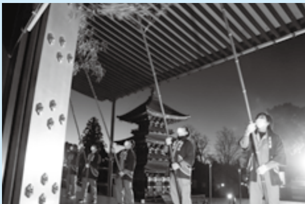
新年に向けて軒下のほこりを落とす

成田山新勝寺で、年末の恒例行事「すず払い」が行われました。参拝客に迷惑を掛けないよう日の出までに終わるのが習わしで、午前4時50分の朝護摩で本尊の不動明王にすず払いの開始を奉告。約40人の僧侶や職員が仏具を布で磨き、296畳もの広さがある大本堂をほうきがけしました。最後には堂内の欄間と大本堂正面の軒下のほこりを長さ約8メートルの笹竹を使って落とし、新年を迎える準備を整えました。