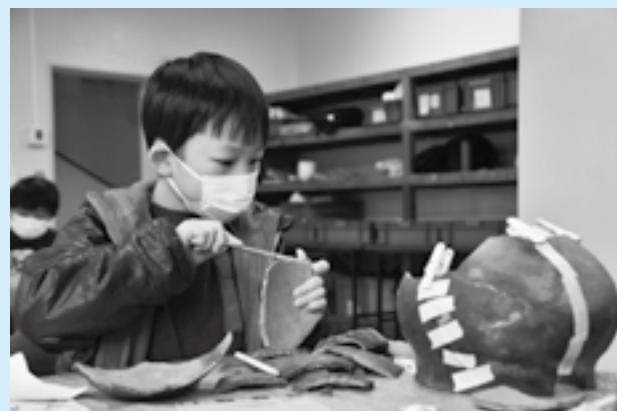
丁寧に接着剤を塗る

考古学に親んでもらおうと「考古学体験教室」が滑河文化財保存展示施設で開催されました。参加者たちは、色や模様、形などをヒントに本物の土器の復元に挑戦。つなぎ合わせられる所を探せたら、接着剤を塗ってテープや洗濯ばさみでかけらを固定しました。参加者は真剣な表情で作業を進め「くつつく所を見つけるのが楽しい」と話していました。