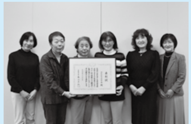
表彰状を手にするコスモスの会の皆さん

コスモスの会は、市立図書館主催の「婦人ボランティア養成講座」の修了者を中心に昭和63年に結成された音訳グループ。以来、同館の音訳協力者として録音図書の製作を行い、市内をはじめ、全国の障がいのある人へ情報を発信し続けてきました。この活動が、障がい者の生涯学習を支援する模範的な活動として認められ、文部科学大臣表彰を受賞しました。同会の皆さんは「今後もこの活動を続けていきたい」と笑顔で話していました。