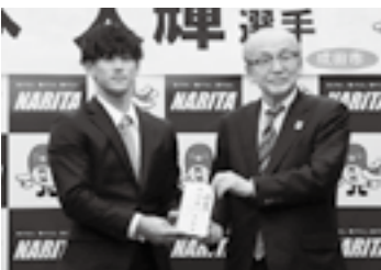
世界での活躍をたたえて(21日)