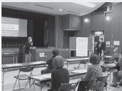
○セカンドキャリアデザイン講座

高齢者の生きがいづくりと、地域におけるリーダーづくりを目的として実施している事業です。生きがいづくりに積極的で多趣味な高齢者は、地域においてもリーダーとして活躍しているケースが多く見受けられます。まず生きがいづくりで公民館を利用いただき、その中で学んだことを地域に還元していく流れを作っていきます。