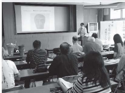
○なりた郷土史セミナー