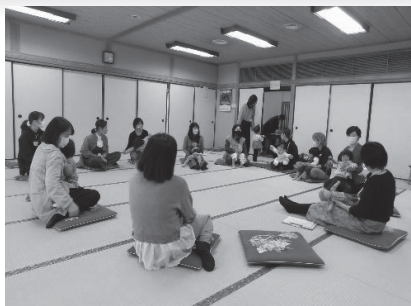
○うたおう！あそぼう！わらべうた講座

家庭における子どもへの教育を支援をする事業です。未就学児と保護者の方が一緒に参加していただく講座もあります。同じ年齢のお子さんが集まるので、保護者の交流の場にもなります。また、参加者の中には公民館を普段利用されない方も多く、公民館を利用していただくきっかけにもなっています。