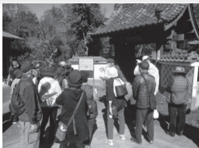
○八生地区歴史散歩

価値観が多様化し変革する時代の中で、自分たちが住む地域に対する意識も徐々に希薄化してきているように思えます。自分たちが暮らす地域を再度見つめ直し、そこに愛着を見出すことで、ふるさと意識を育むことが大事だと考えます。