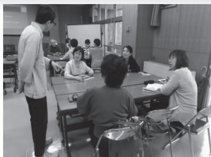
○日本語ボランティアスタッフ養成講座

地域のコミュニティを支援する事業です。特に在留外国人が、地域に溶け込み生活しやすくなり、やがては地域の人材として地域の運営に参画することを目的として、「外国人のための日本語教室」を実施しています。この講座は日本語ボランティアの皆さんにより運営されていますので、そのボランティアを育成する「日本語ボランティアスタッフ養成講座」も開催しています。