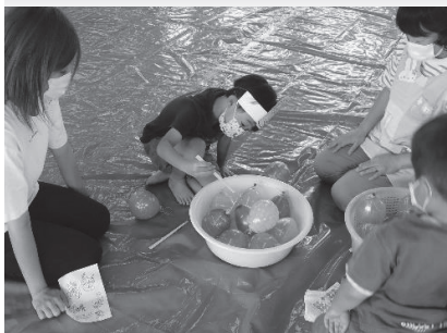
○にこにこ親子広場