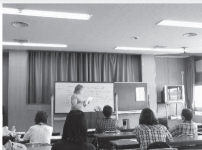
○初心者のための英会話教室

実生活で役立つ講座から、趣味をはじめめるきっかけとなるような講座まで、幅広く開催しています。実際に講座参加者の中からサークルを立ち上げ、活動を続けているケースもあります。