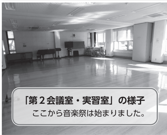
「第2会議室・実習室」の様子 ここから音楽祭は始まりました。

今回は、30回目の開催を記念してこちらのホールで開催しましたが、実はこれまでは、玉造公民館の「第2会議室・実習室」で開催していたのです。