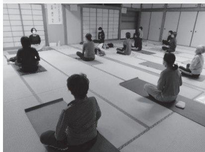
○ナイトヨガ入門教室