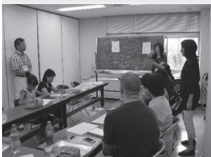
○外国人のための日本語教室