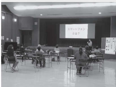
○シニア向けスマートフォン教室