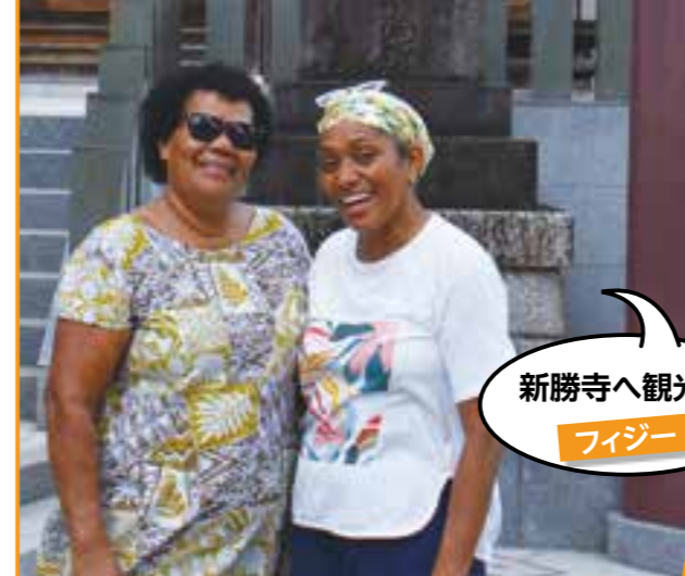
新勝寺へ観光に フィジー