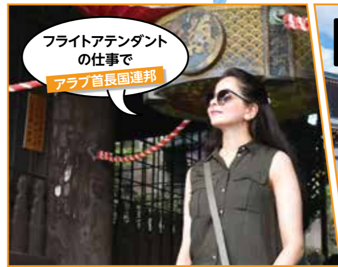
フライトアテンダントの仕事で アラブ首長国連邦