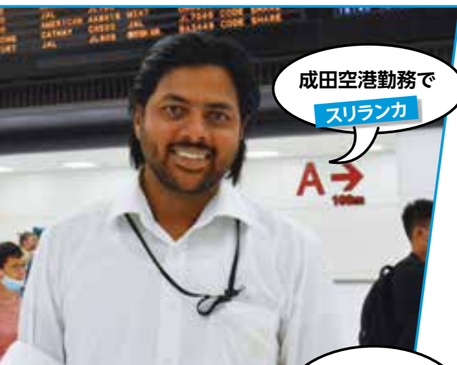
成田空港勤務で スリランカ