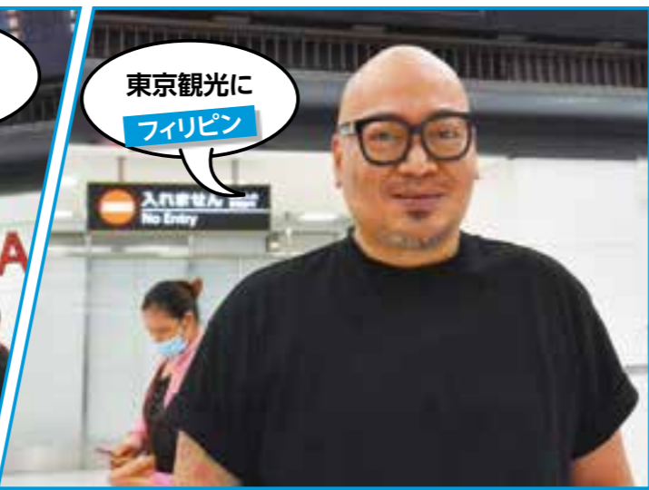
東京観光に フィリピン