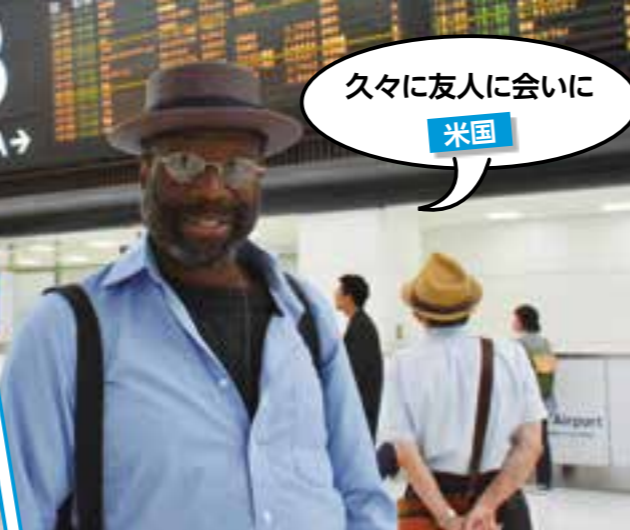
久々に友人に会いに 米国