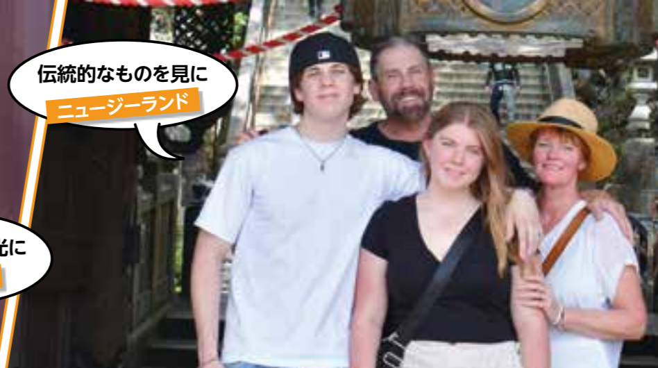
伝統的なものを見に ニュージーランド