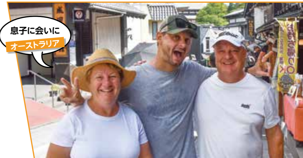
息子に会いに オーストラリア