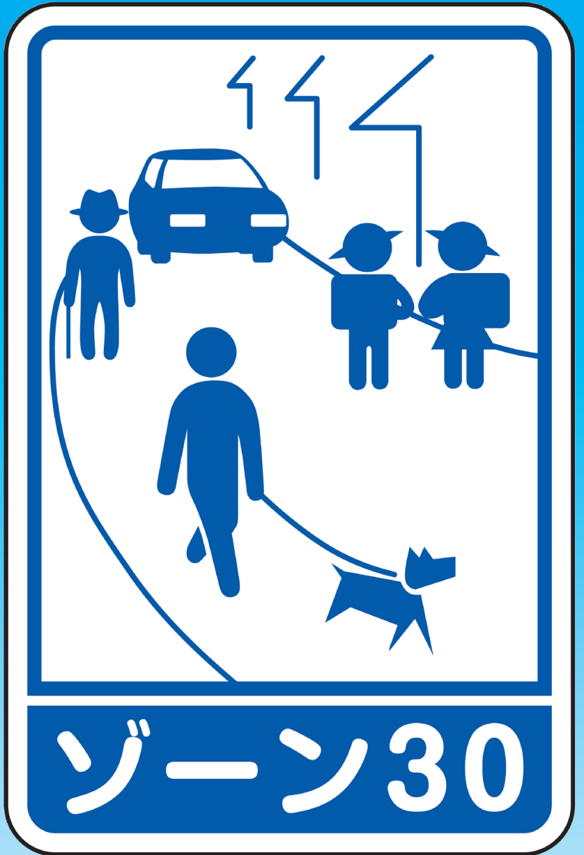
「ゾーン30」シンボルマーク看板