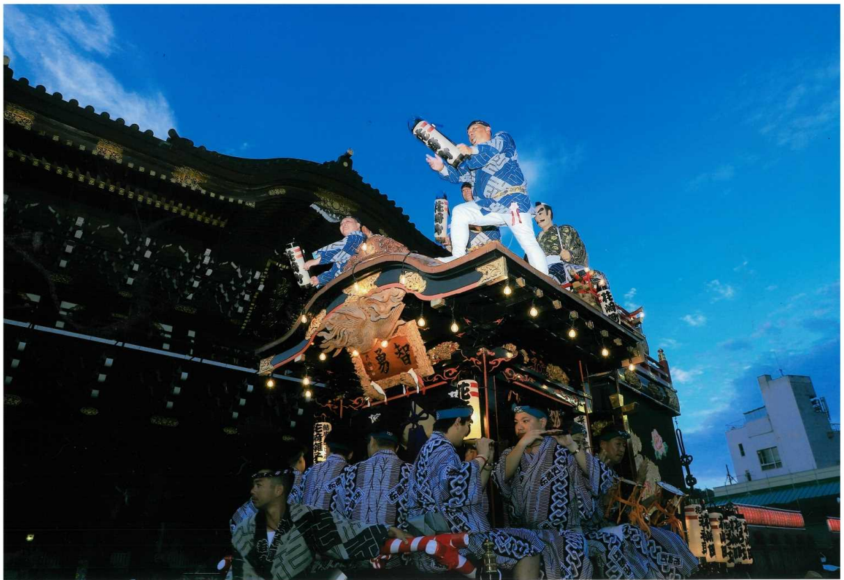
『総門前の男衆』 青柳 幹市（東庄町）