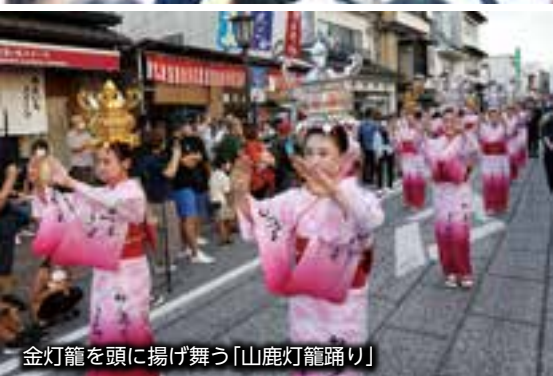
金灯籠を頭に揚げ舞う「山鹿灯籠踊り」