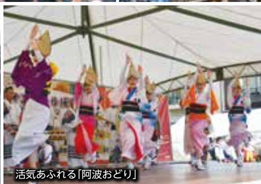
活気あふれる「阿波おどり」