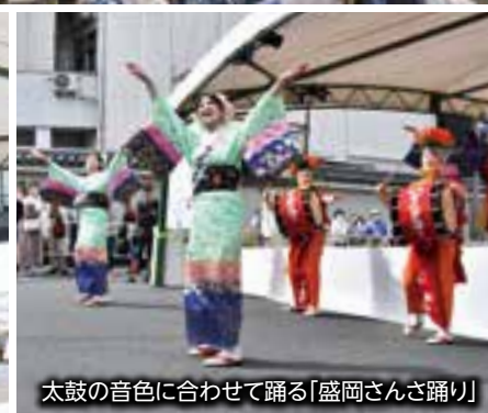
太鼓の音色に合わせて踊る「盛岡さんさ踊り」