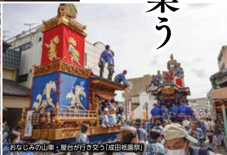
おなじみの山車・屋台が行き交う「成田祇園祭」