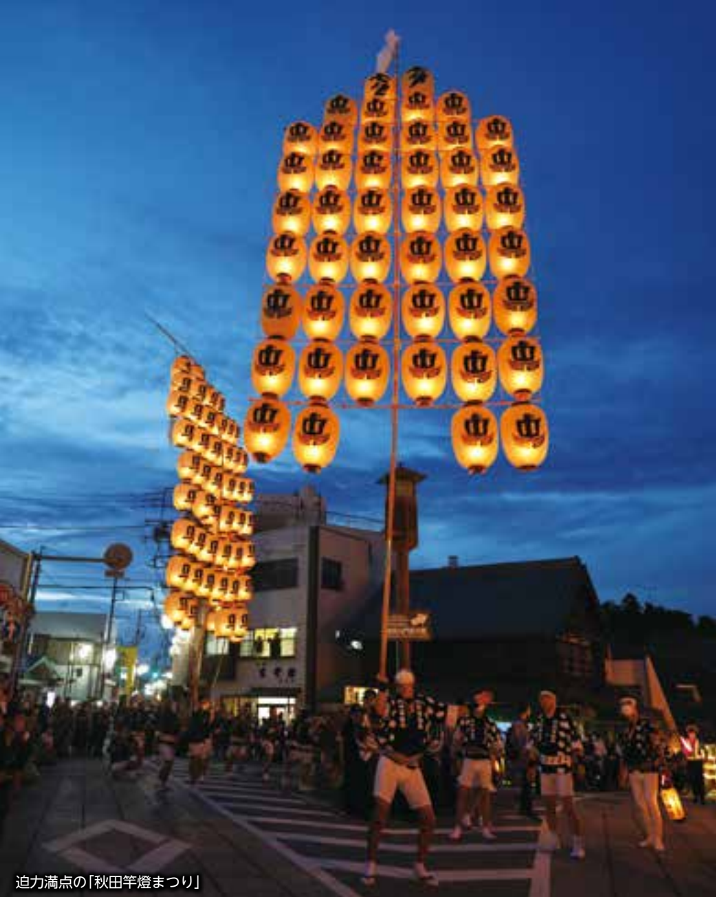
迫力満点の「秋田竿燈まつり」

市内をはじめ、県内外から日本を代表する伝統芸能団体が集まり、多彩な祭りや踊りを披露する「成田伝統芸能まつり秋の陣」が9月16日(土)・17日(日)に開催されます。また、16日には出演団体によるパレードも行われます。