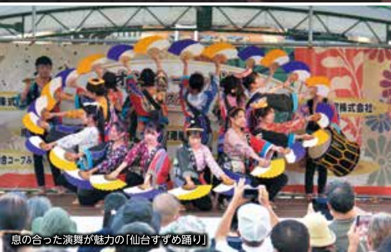
息の合った演舞が魅力の「仙台すずめ踊り」