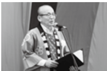
出陣式であいさつ(20日)