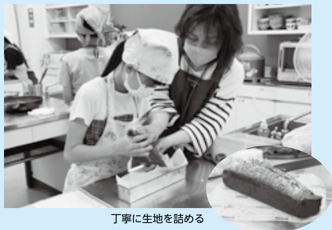
丁寧に生地を詰める

料理の楽しさを知ってもらおうと「チャレンジ料理教室」が国際文化会館で開かれました。参加した小学生は講師から材料の混ぜ方などのおいしく作るポイントを教わりながら、チョコレートケーキ作りに挑戦。チョコレートやバターなどを混ぜた生地を型に詰め、オープンに入れた後、焼けるのを待つ間には、食に関する講義も行われました。生地が焼き上がると、最後に粉砂糖を振りかけて、おいしそうなケーキを完成させました。