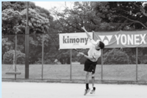
強烈なサーブを放つ

県内外から集まった参加者による真剣勝負が繰り広げられる「障がい者立位テニス東日本大会」が重兵衛スポーツフィールド中台テニスコートで行われました。立位テニスは、車いすテニスとは違い、足に障がいのある人だけでなく、手や腕、体幹機能に障がいのある人もプレーできる競技。選手がそれぞれの障がいに合わせたプレースタイルで、力強いサーブやショットを繰り出し、迫力ある試合を展開していました。