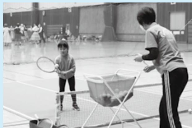
ボールをよく見て

幅広い年齢層の人が気軽に楽しめるニュースポーツの魅力を知ってもらおうと「レクリエーション祭」が重兵衛スポーツフィールド中台体育館で開催されました。会場にはバウンドテニスやユニカールなどの体験ブースが設けられ、子どもたちはスタンプラリー形式で回りました。初めて挑戦する競技でもスタッフから説明を受けるとすぐにコツをつかみ、得点を競い合っていました。