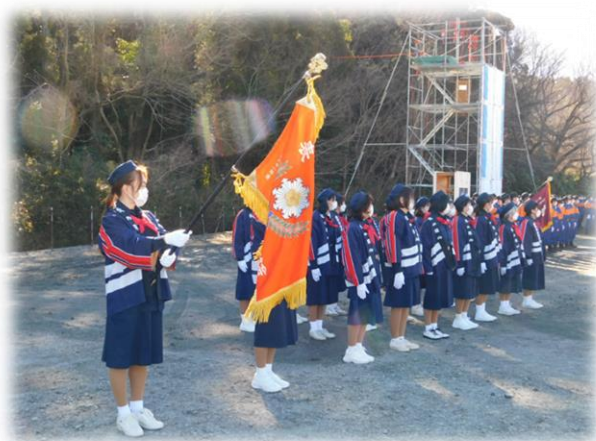
令和5年成田市消防出初式（令和5年2月）