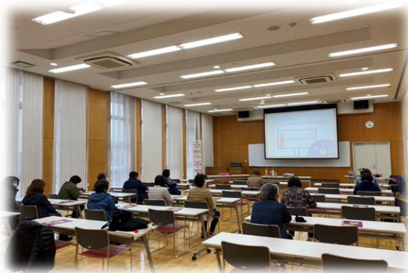
赤坂消防署で消火器取扱い講習を実施（令和4年11月）