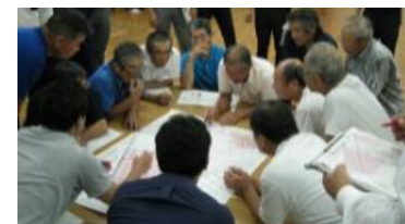
将来の目標地図例