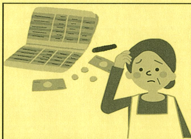
(どこに相談すればいいかわからない)