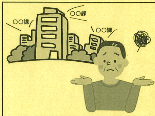
(役所の説明がわからない)

総務省の行政相談委員が「行政困りごと相談所」を開設しています。 行政への苦情・要望・意見を受け付け、助言や行政機関に対する通知 などを行っています。(相談無料・秘密厳守)