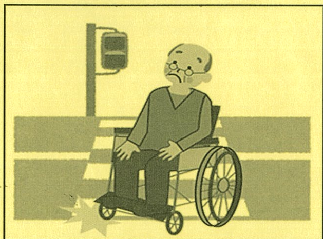
(道路の段差をなくしてほしい)