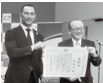
感謝状を受け取る(2日)