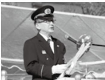
消防団員を激励(5日)