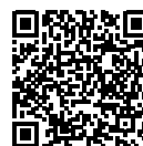
厚生労働省 ホームページ

省ホームページ( https://www.mhlw.go.jp/stf/seisakunitsuite/bunya/kansentaisaku_00001.html )で確認してください。