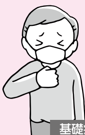
基礎疾患がある人