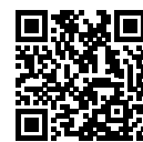
ワクチン接種 予約サイト

予約方法＝ワクチン接種予約サイト( http://www.narita-vaccine.jp )または成田市新型コロナウイルスワクチン接種コールセンター(☎0120-11-5828)へ。当日受け付けも行っています