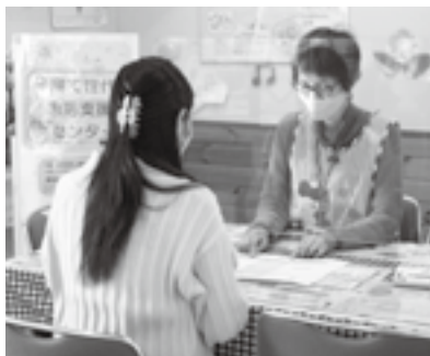
安心して相談してください

全ての人が安心して出産・子育てできるように、妊娠期から出産・子育てまで助産師や保健師などの専門職が一貫して身近で相談に応じる伴走型相談支援を実施しています。