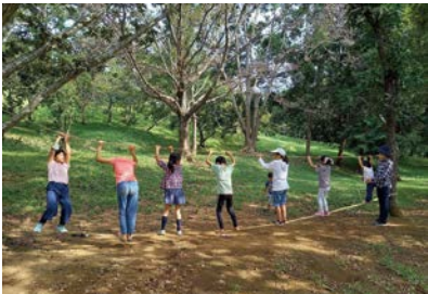
成田おむすびプレーパーク

子育て支援団体の成田おむすびプレーパークでは、月に2回、赤坂公園で子どもたちの遊び場としてプレーパークを開催しているが、大人や子どもから月2回の開催は少ない