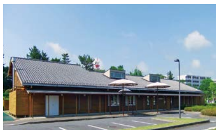
こども発達支援センター

外出することが著しく困難な重度の障がい等のある児童の居宅を訪問し、日常生活での基本的な動作の指導、知識技能の獲得などの支援を継続的に