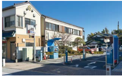
成田市第一駐車場(花崎町)

A 導入当初の機器の設置、導入後の決済手数料などの一定の費用は発生するが、駐車場利用者の精算時における時間の短縮が図られるなど、利便性が向上することで、より多くの方に利用していただけるものと考えている。また、指定管理者における精算機の釣り銭管理などの効率化が図られ