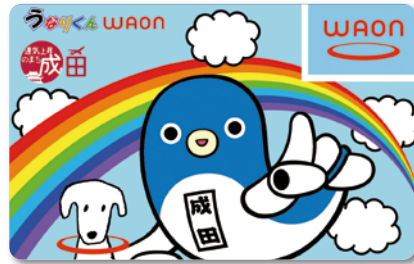
うなりくんWAONカード

A うなりくんWAONカードは全国のWAON加盟店で利用すると、支払金額の0.1%が本市へ寄付されることとなっている。物価高騰の折、子育て世帯の家計負担の軽減を図ることに加え、キャッシュレス化の推進や、市への寄付効果があるカードを普及促進させていくことで、市の歳入増加をも目指していくといった複数の政策効果が期待できることから、うなりくんWAONカードを交付することとした。