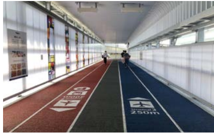
駅から遠い第3ターミナル(連絡通路)

更なる機能強化により旅客や貨物施設等の処理容量の大幅な向上が必要となることや、施設の多くは1970年代に整備され、老朽化が深刻な問題となっていること等から、旅客ターミナルの再構築や航空物流機能の高度化、空港アクセスの改善、近隣地域との一体的な発展等に関して、『新しい成田空港』構想の検討が必要な状況とのことでした。構想検討会では、更なる機能強化を推進すること、旅客ターミナルを再構築