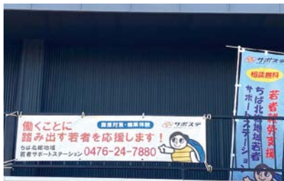
労働者協同組合へ移行を検討するNPO法人

令和2年12月の臨時国会で労働者協同組合法が可決成立し、令和4年10月1日に施行された。この内容は、組合と組合員が労働契約を締結するが、雇用、雇われるという関係を超え、