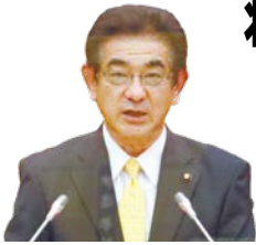
かんざき まさる 神崎 勝 議員