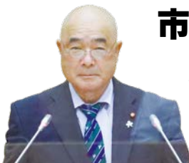
むらしましょうどう 議員