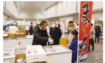
成田楽市年末特別大売り出し

場内事業者からは、新たにサツマイモの輸出取引を開始されたことや、バイヤーから要望のあった冷凍水産物の調達に向けた調整を進めているとの報告があったとのことでした。