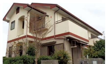
空き家バンクに登録された建物の例

もらう、行動してもらうなどの意識啓発が重要であることとなりました。第2次計画では、空き家対策パンフレットの配布や無料相談会を実施することで空き家化の予防を図るとともに、空き家バンクの活性化により、空き家の流通・活用を促進するほか、固定資産税の住宅用地特例解除の検討や補助制度創設の検討を行い、特定空き家化の予防を図るなど、管理不全な空き家化の抑制・減少を目指していくこととなりました。