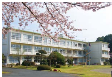
創立120周年の遠山小学校

式学級を解消している。令和5年度以降、当面の間は全校児童40名前後の規模で推移していくが、将来的には、社会的要因により大きく変動することも考えられる。教育委員会