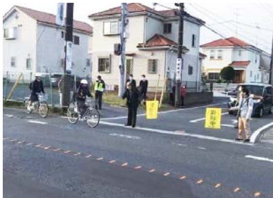
市長が自ら横断旗を持って、遠山中学校の朝の通学状況を確認

11月28日の朝、遠山中学校の通学路で交通量の多い県道成田松尾線の新駒井野入り口のT字路を市長と共に視察した。将来の宝である子ども