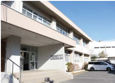
子どもたちの社会的自立や学校復帰に向けた支援を行うふれあいるーむ21

教育機会確保法第13条では、「不登校児童生徒の休養の必要性」「不登校児童生徒の状況に応じた学習活動」が認められている。保護者の中