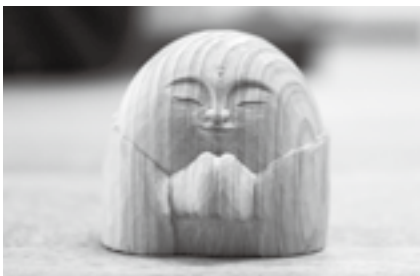
自慢の作品が出来上がり

※申し込みは12月17日(土)から同館(☎27-5252、第4月曜日は休館)へ。