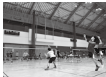
狙いを定めてスマッシュ