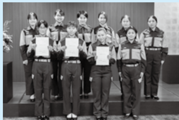
辞令を手にする学生たち

地域防災力のさらなる向上を目標に掲げ活動をしている市消防団女性部。新たに国際医療福祉大学の学生が団員として加わることに伴う辞令交付式が同大学成田キャンパスで行われました。今回入団するのは、同大学医学部医学科の1年生3人。今後、防災関連のイベントにおいて救急講習の指導や火災予防啓発などの活動を行っていきます。