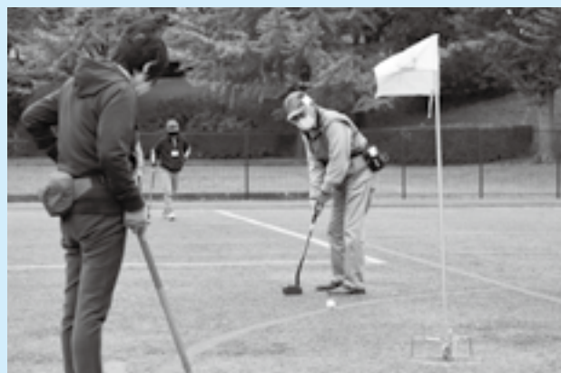
打ったボールの行方は

グラウンド・ゴルフの楽しさを知ってもらおうと「グラウンド・ゴルフ教室」が重兵衛スポーツフィールド中台球技場で行われました。全14回のうち最終回のこの日は、参加した76人がグループに分かれて8ホールをプレー。参加者はこれまでに教わったことを実践しながら自己ベストの成績を目指しました。ホールインワンを達成するとグループから拍手と歓声が沸き起こり、大いに盛り上がりました。