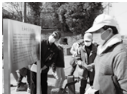
遺跡から歴史を学ぶ