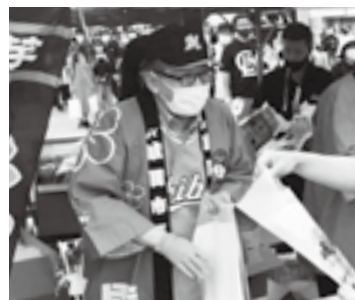
来場者をおもてなし(3日)